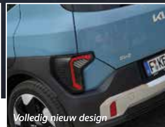
Volledig nieuw design